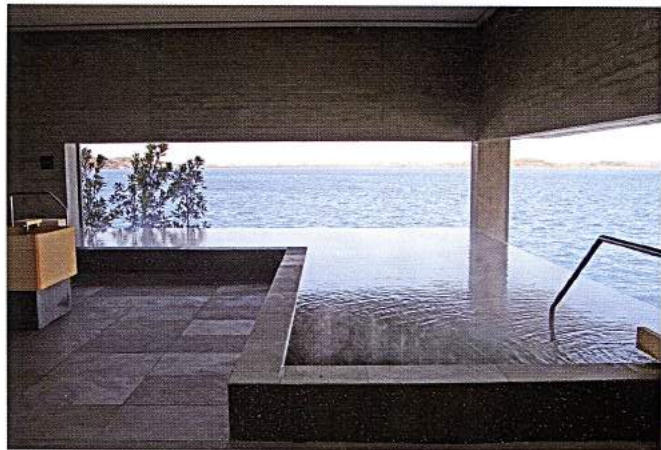
目の前に広がる柴山湯と湯船の水面が連続したかのように見える「湯の湯」では水に浮かんでいるかのような感覚に。夜の入浴はより幻想的な雰囲気を楽しめる。