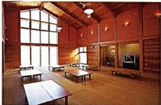
上/湯船から洗い場の様子が見えないように設計されている内風呂。下/畳の休み処には、健康増進に役立つ器具も完備。