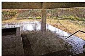
芝生でくつろいでいるかのような「森の湯」。

タイリッシュな現代アートを展示する美術館のような外観が特長的な「片山津温泉総湯」。建物を設計したのは「ニューヨーク近代美術館」や「鈴木大拙館」などを手掛けた谷口吉生氏で、水との親和性が高い設計を数多くデザインしている。ここでは「湯の湯」、「森の湯」の2種類が一日交代で楽しめる。「湯の湯」は目の前に広がる柴山湯と湯船が一緒に見えるように設計されており、湯に浸かっているかのような気分になれる。